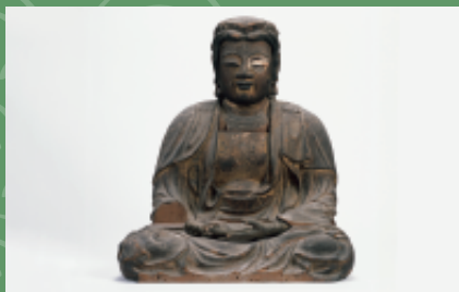
木造釈迦如来坐像(医光寺)